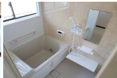
システムバス (手すり付)