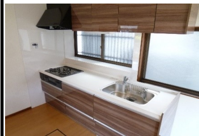
システムキッチン (3口コンロ、吊戸棚、スライド収納)